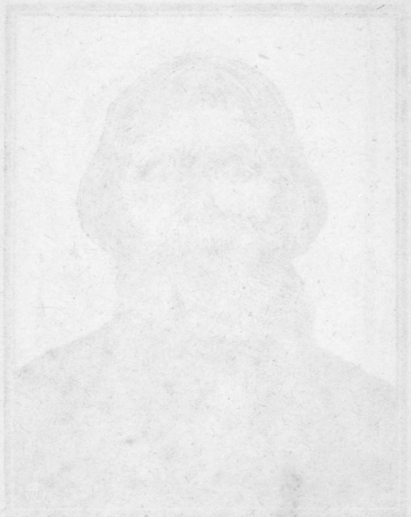
Портрет Екатерины II